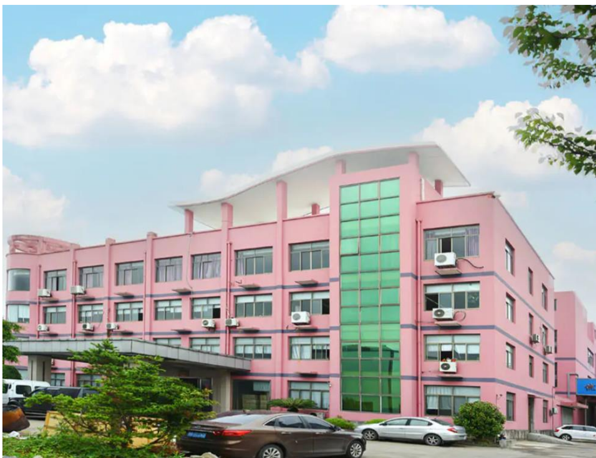
图表 B-1 厂区概貌

宁波市西赛德渔具有限公司（以下简称“公司”）创建于2010年，由一批多年从事渔轮开发、设计、生产、销售的专业人员组建，目前厂房占地面积8000余平方米，位于宁波市鄞州区五乡镇联合村（距宁波机场10公里，距宁波火车站8公里）。公司采用先进进口设备和先进机械加工技术，结合专业的技术团队，专业设计开发和生产销售各种高中档精密钓具，年产渔轮200万套。公司的业务伙伴都是世界知名渔具公司，或者所在国家著名渔具销售公司，产品行销美国、日本、法国、德国、英国、意大利、西班牙、波兰、丹麦、澳大利亚及东南亚、南美等四十多个国家与地区。公司重视环境保护和员工职业健康安全，致力于可持续发展的企业理念，先后获得了ISO 9001、ISO 14001、ISO 45001等管理体系认证。公司从创新发展中一路走来，不断引进人才，强化管理，用优秀的企业文化，持续为员工创造价值，形成了独有的管理之本，满足市场多元化需求，推进行业转型升级，精铸企业宏伟的未来！